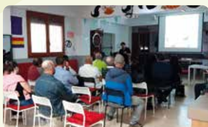
Xarrada informativa sobre el cultiu de l'ametlla a Albocàsser