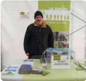
Feria de El Toro (Alto Palancia).