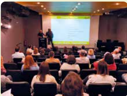
Jornada tècnica persones treballadores de LA UNIÓ.