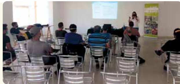
Curs Pla Riscos Laborals a Les Alqueries.