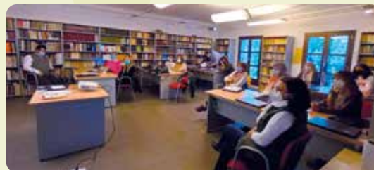
Taller de Dones de LA UNIÓ a Montesa.