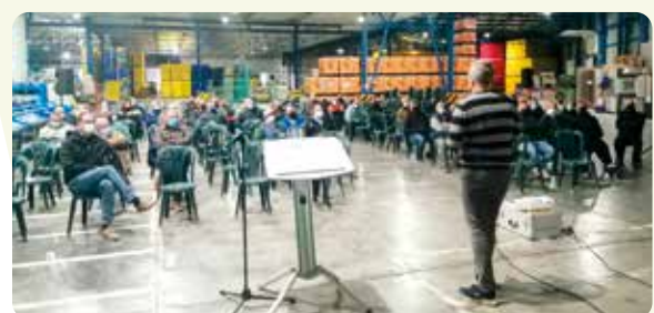
Xarrada informativa sobre el cultiu de la pitahaya a Callosa d'En Sarrià