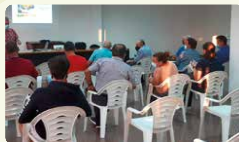
Xarrada informativa Cotonet de Sud-àfrica a Poble Nou.