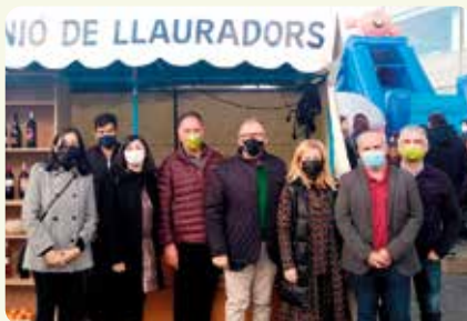
Fira de Cabanes (Plana Alta).