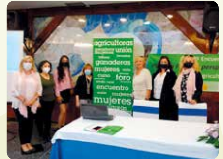
Jornada estatal de Dones de la Unió de Unions.