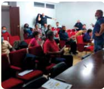
Curs Manipulador de Plaguicides a Xàtiva.