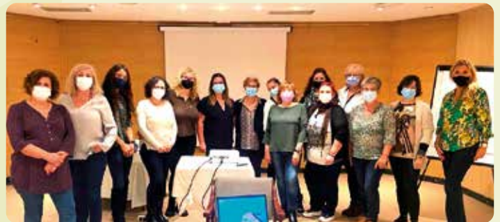
Jornada de Dones de LA UNIÓ a Gandia.