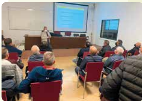
Jornada sectorial de l'arròs a Sueca.