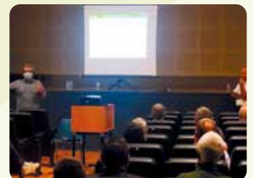
Xarrada informativa Cotonet de Sud-àfrica a Lloc Nou d'En Fenollet.