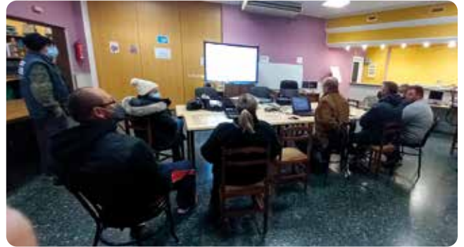
Venta del Moro.

Se han celebrado ya charlas en Las Cuevas, Fuenterrobles, Sincarcas, Requena, Venta del Moro, Camporrobles, Utiel, Los Isidros y San Antonio.