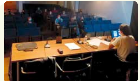
Curso de Agricultura Ecológica en Utiel.