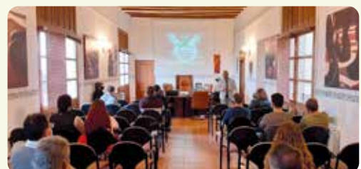
Jornada de joves de LA UNIÓ a Otos.