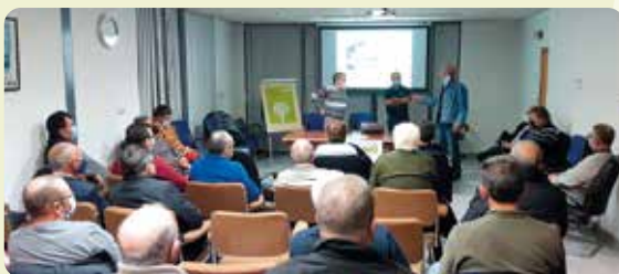
Xarrada informativa Cotonet de Sud-àfrica a Llutxent.